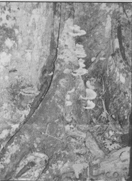
"טאץ' ווד". צבע וטבע בכפר-מסריק